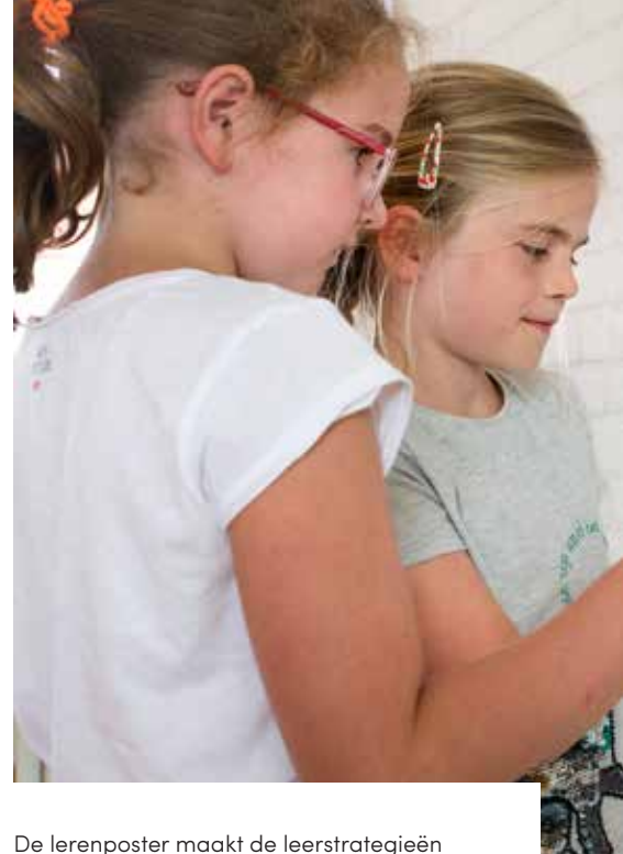
De lerenposter maakt de leerstrategieën inzichtelijk; voor elke strategie is een bijpassend 'monstertje' bedacht

Op de meeste SKOzoK-scholen wordt inmiddels gewerkt met de leidraad leren leren. Op een aantal scholen is het concept al ver doorontwikkeld, andere scholen zitten nog in de introductiefase. Het leren leren begint met een oriëntatiefase aan de hand van theorie. Daarna volgt de introductie op de scholen met behulp van monstertjes. Vervolgens gaan scholen experimenteren met het gebruik van