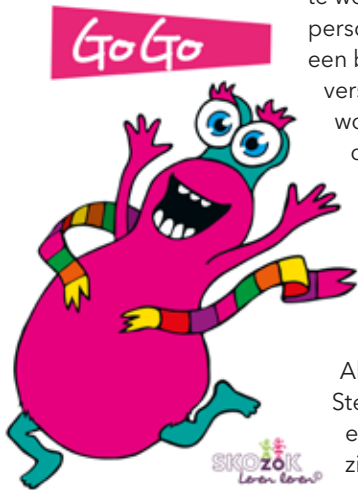
Figuur 2 – Het monstertje GoGo staat voor doorzettingsvermogen